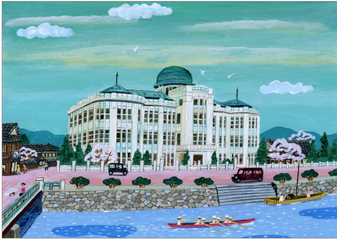
広島県物産陳列館