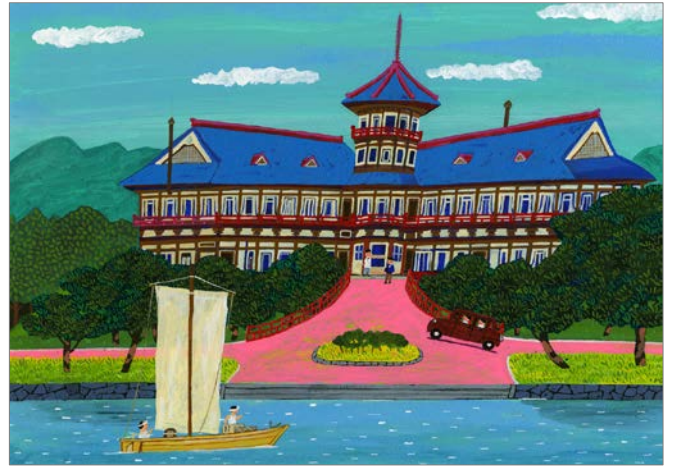
松島パークホテル